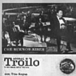
Anibal Troilo Che Buenos Aires RCA 3899