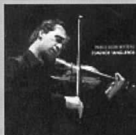
Pablo Agri Sexteto Acqua Records 442 Tango Store www.tangostore.com

Nessuno arrivò, come lei, a comporre tangos con parole di tanto successo, e in casi isolati di tanta qualità, specie alla fine degli anni '60, il periodo più nero per il tango, la cui popolarità era arrivata in Argentina ai minimi storici. La Blazquez creò un tango canción veramente innovativo, ma non sperimentale, mantenendosi nell'ambito della tradizione. La sua rara abilità a miscelare le note e le parole, le sue nuove tematiche e il linguaggio utilizzato furono le caratteristiche che crearono il maggior impatto nel pubblico; i tradizionalisti la accolsero con freddezza ma senza l'aggressività che riservarono ad altre proposte più singolari. È del 1970 il suo primo LP dedicato al tango che include "Sueño de barrilete" e "Mi ciudad y mi gente" tema vincitore del Festival della Canzone di Buenos Aires del 1970, successivamente "El precio de vencer", uno dei temi più impegnati da lei composto, registrato nel '73, anno in cui in Argentina predominavano le idee politiche più radicali, e infine il suo tango più popolare "El corazón al Sur". Eladia Blazquez ci ha lasciati il 31 Agosto di quest'anno all'età di 74 anni, ma le sue opere continueranno a parlare di lei.