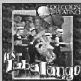
Los Tuba Tango Stilo Canyengue Music Hall- Sicamericana 1140